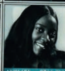
AKWAABA OBAA YAA

ANGLAIS ALLEMAND ESPAGNOL ITALIEN RUSSE PORTUGAIS CHINOIS JAPONAIS ARABE