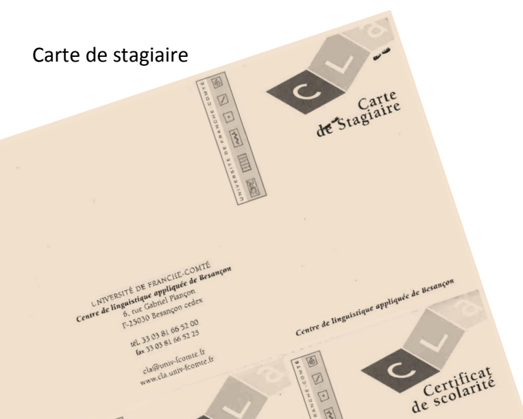
Carte de stagiaire

Sécurité : vos sacs peuvent être contrôlés. Par ailleurs, vous êtes invité(e) à utiliser l'escalier intérieur ou les ascenseurs mais pas les passages extérieurs.