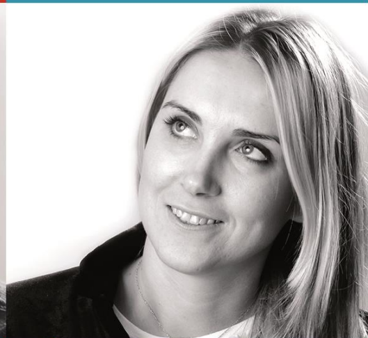
добро пожаловать MARINA